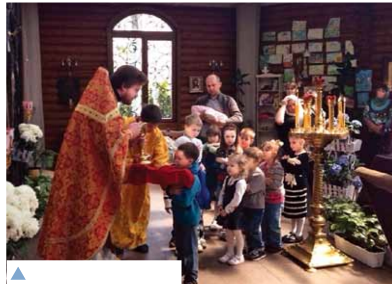
▲ В очікуванні Причастя. У храмі 20 дорослих і 40 дітей!