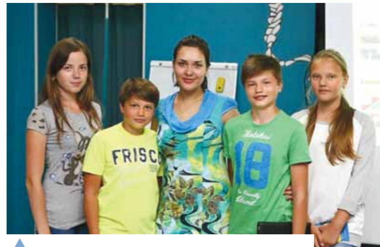
▲ Вихованці дитячого клубу «Недільна школа» відвідали майстер-клас українки, яка вступила до 17 європейських вишів