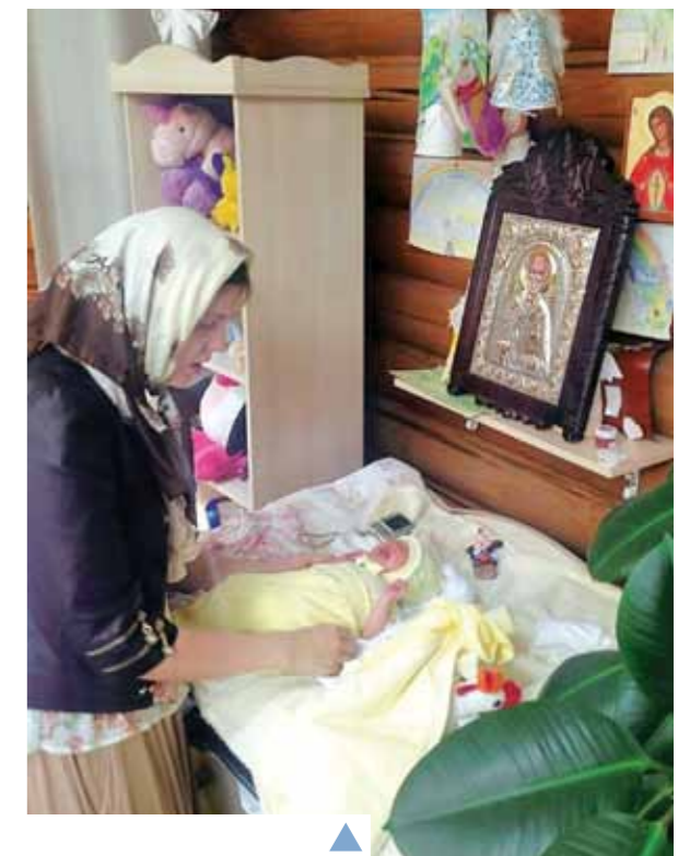
▲ Наші найменші парафіяни! Ось навіщо пеленальний столик у храмі!