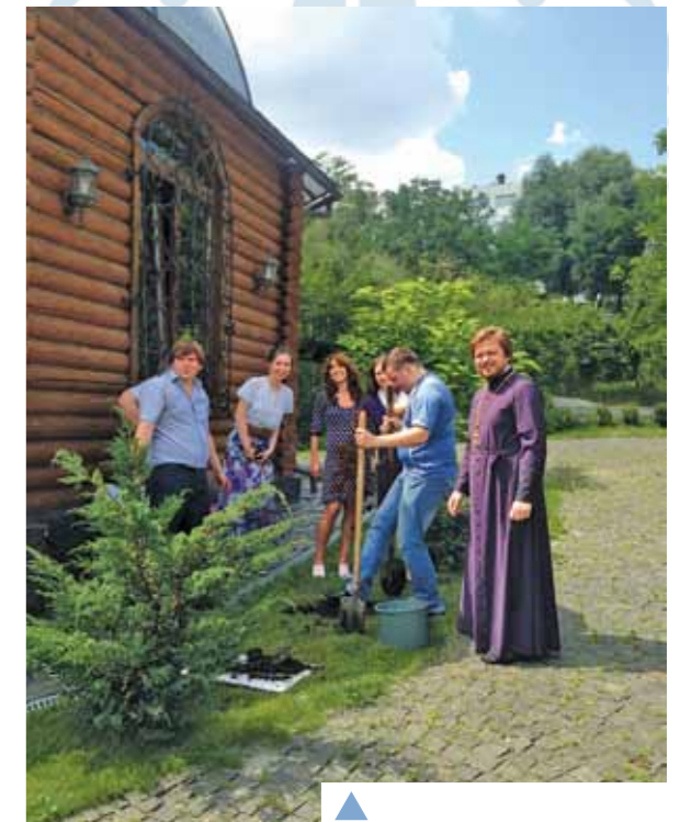
▲ Сімейних дерев біля нашого храму стає все більше!