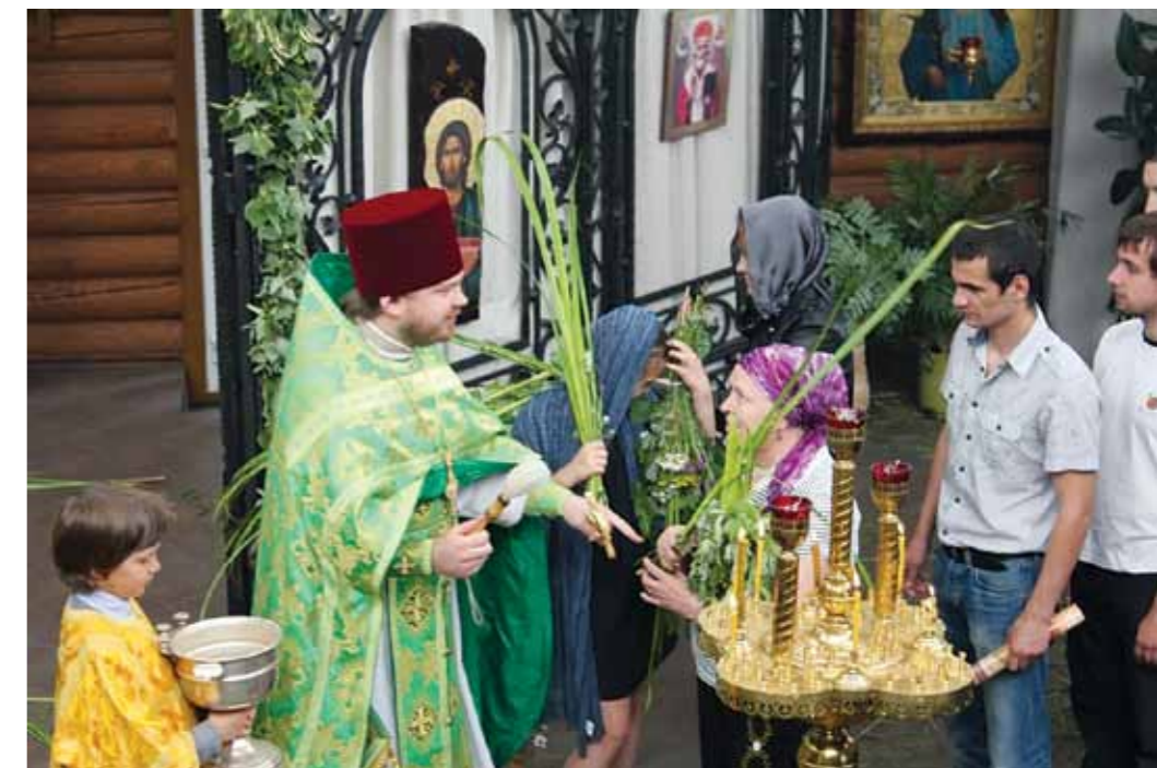
В этот день православные христиане украшают храмы и дома зелеными ветвями и цветами